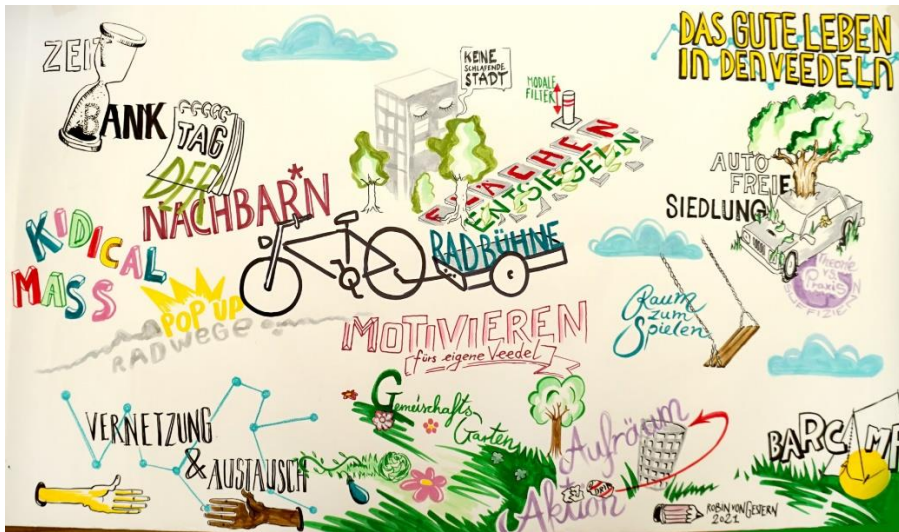
Abbildung 1 Abbildung zum „Treffen der Zukunft und Nachbarschafts-Macher:innen“ aus der Website von Agora Köln