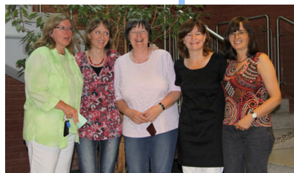
Sozialdienst kath. Frauen e.V.