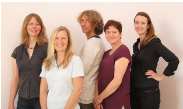
Beratungsstelle für Bewusste Elternschaft