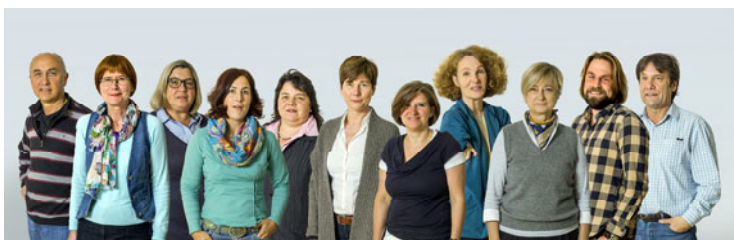
Psychologische Beratungsstelle DWKS