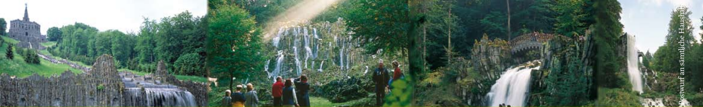
Postwurf an sämtliche Haushalte