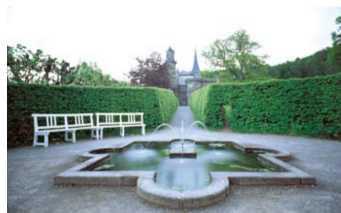
Die Löwenburg ist malerisch im Park gelegen. Die Sanierung wird im Jahr 2015 abgeschlossen sein