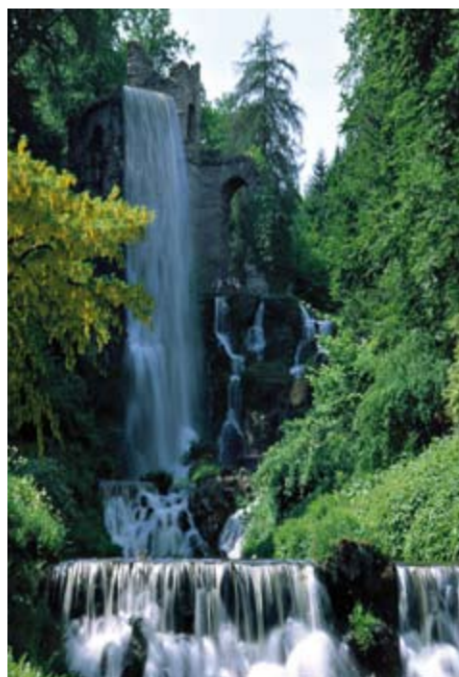
Monumentales Wassertheater im Bergpark: das Aquädukt mit den Peneuskaskaden

Der Bergpark mit seinen Wasserkünsten ist weltweit einzigartig. Nirgendwo sonst gibt es einen Park, in dem über eine Entfernung von rund zwei Kilometern und fünf zentrale Stationen hinweg mit unterschiedlichen „Bühnenbildern“ ein monumentales Wassertheater inszeniert wird: von den Steintreppen und künstlichen Felsformationen der Großen Kaskade, wo die Wasser vom Tönen klingender Röhren begleitet werden, weiter über den Steinhöfer Wasserfall und den Wasserfall an der Teufelsbrücke zum Aquädukt mit den Peneuskaskaden und schließlich bis zum Fontänenbecken mit der nur durch Wasserkraft ca. 50 Meter hoch steigenden Großen Fontäne als Höhepunkt des rund einstündigen Schauspiels. Mit ihrer Idee monumentaler Wasserkünste am Berg unterschieden sich die Kasseler Fürsten von den Standesgenossen ihrer Zeit grundsätzlich. Während andere barocke Fürsten ihren Herrschaftsanspruch in weitläufigen Parklandschaften in der Ebene zur Schau stellten, triumphierte in Kassel Landgraf Carl über die Natur, indem er ungeheure Wassermassen scheinbar auf der Spitze eines Berges entfesselte und kunstvoll in Bahnen lenkte. Bis heute werden dafür insgesamt 750 000 Liter Wasser in verschiedenen Becken gesammelt und durch unterirdisch unter dem Habichtswald verlaufende Röh-