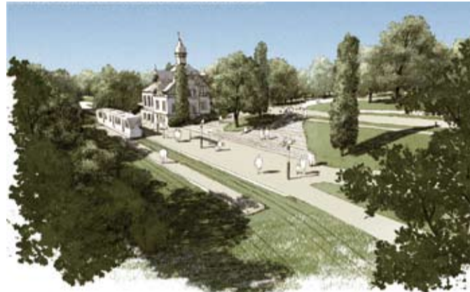
Die Tulpenallee, hier oberhalb des Stationsgebäudes beziehungsweise der Alten Wache dargestellt, wird nach historischem Vorbild als Parkstraße ausgebaut. Der Umbau erfolgt im Jahr 2012