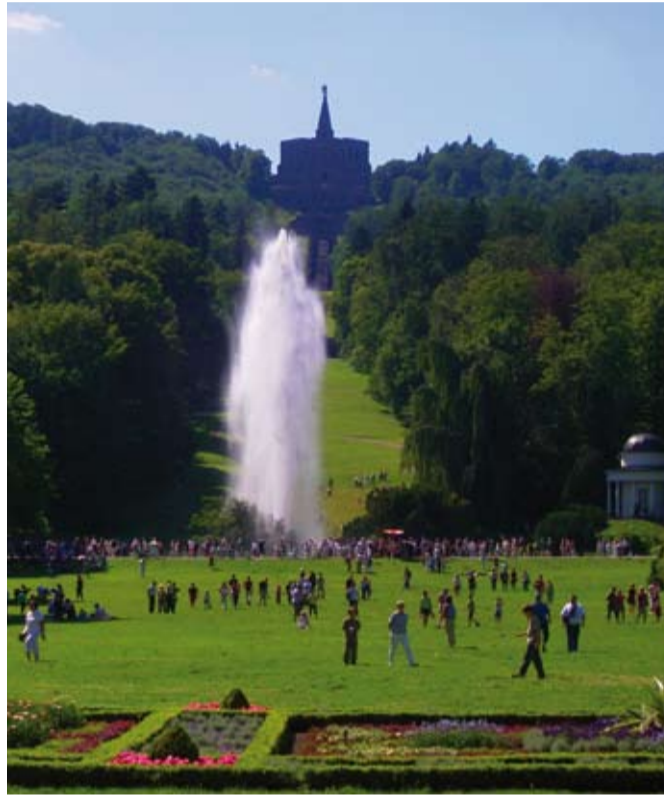
Die Wasserspiele und ihre Bewunderer sind am Ziel: Vor der Gartenseite des Wilhelmshöher Schlosses springt die Große Fontäne über 50 Meter hoch – der krönende Höhepunkt des einstündigen Spektakels

Die Ruinenromantik der Löwenburg, die Roseninsel, auf der die älteste deutsche Zuchtrose blüht, das Große Gewächshaus und das Schloss Wilhelmshöhe, laden Einheimische, Touristen und Tagesausflügler zu langen Spaziergängen ein