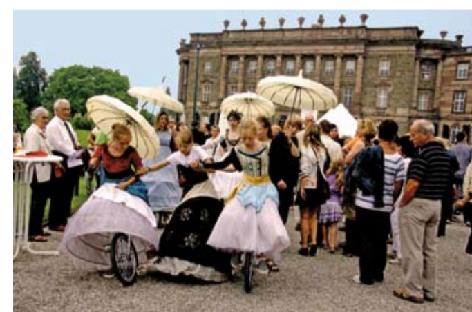
Beliebter Veranstaltungsort vor prächtigen Kulissen: Feste wie das „Höfische Fest“, die „Beleuchteten Wasserkünste“, das Bergparkfest und der historischen Gartenanlage angepasste Open-Air Darbietungen – so lässt sich die Schönheit des Bergparks Wilhelmshöhe für Besucher aus Nah und Fern besonders reizvoll erleben

Die Aufnahme in die Liste würde dazu führen, dass die Erhaltung der Welterbestätte von einer regionalen zu einer nationalen Angelegenheit wird und sich damit auf mehr Schultern verteilt als bisher. Nicht nur das Land Hessen als Träger der Anlagen und die Stadt sowie der Landkreis als Anrainer und Miteigentümer, sondern auch die Bundesrepublik Deutschland insgesamt muss sich mit der Bewerbung verpflichten, das Welterbe in seiner Einzigartigkeit zu pflegen und zu schützen. Bereits jetzt fließen als Begleiteffekt des Bewerbungsprozesses zusätzliche Gelder für den Ausbau und Erhalt der Wilhelmshöhe.