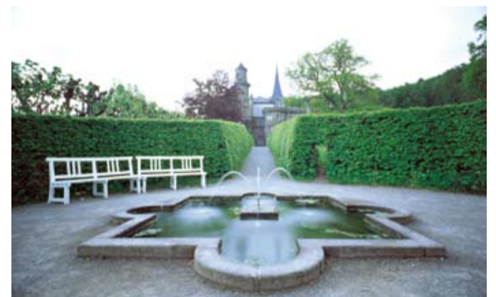
Die Löwenburg ist malerisch im Park gelegen. Die Sanierung wird im Jahr 2015 abgeschlossen sein